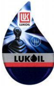
LUK LUKOIL (fig.) (reģ. Nr. WO 980 745),