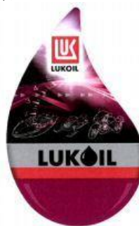
LUK LUKOIL (fig.) (reġ. Nr. WO 999 275),