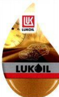
LUK LUKOIL (fig.) (reġ. Nr. WO 999 274),