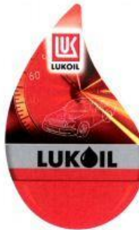
LUK LUKOIL (fig.) (reġ. Nr. WO 999 272),