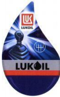
LUK LUKOIL (fig.) (reġ. Nr. WO 999 218),