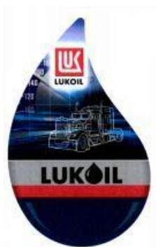
LUK LUKOIL (fig.) (reģ. Nr. WO 999 289),