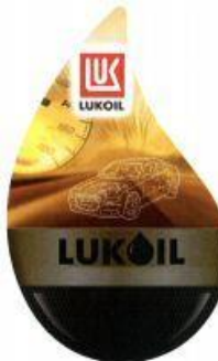
LUK LUKOIL (fig.) (reġ. Nr. WO 999 273),