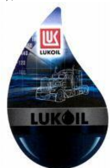
LUK LUKOIL (fig.) (reģ. Nr. WO 999 291),